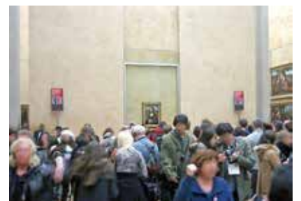
《モナ・リザ》の展示室

こんな状況で、名画を心ゆくまで鑑賞することなどできるはずもなく、SNS上でも不満が炸裂しているようです。美術館側も手をこまねいているわけではなく、近い将来《モナ・リザ》を地下の特別展示室に移動させる、という計画が最近発表されました。ガラスのピラミッドとは別の専用入口を作り、そこから来館者を《モナ・リザ》に誘導するという計画のようです。それで多少混乱は防げるかもしれませんが、適切な鑑賞条件をクリアするためには、やはり入場制限以外に方法はないように思えます。そのうち、どこかのテーマパークではありませんが、《モナ・リザ》専用のファストパスが発行される事態になるかもしれません。(F)