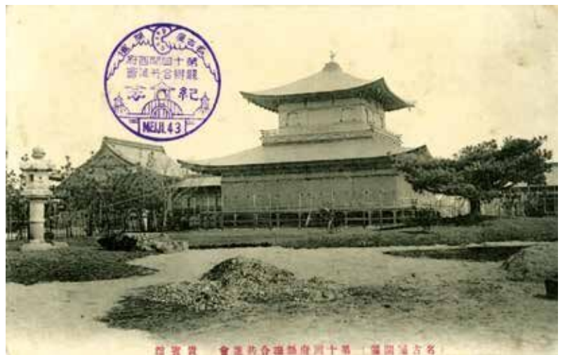
図5 「貴賓館」(菊花堂製「第十回府県連合共進会絵葉書」6枚のうち)、明治43年(1910)、名古屋市博物館蔵(出典:名古屋市博物館収蔵品データベース)