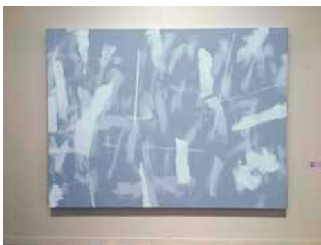
木下佳通代《LA' 92-CA700》油彩・キャンバス(展示風景)

尚、本展覧会は大阪の後、埼玉県立近代美術館に巡回、開催(2024年10月12日-2025年1月13日)されます