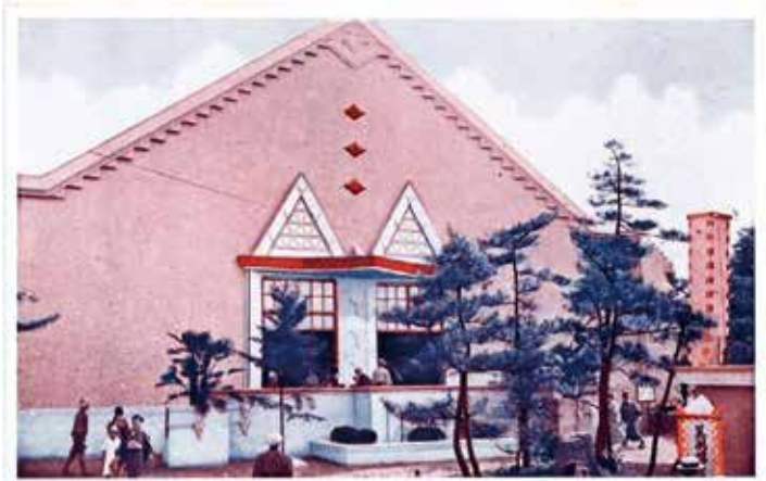
図1 「美術館」(菊华堂製「御大典奉祝名古屋博覧会絵葉書」16枚のうち)、昭和3年(1928)、名古屋市博物館蔵(出典:名古屋市博物館収蔵品データベース)

美術展の会期は博覧会と同じ昭和3年(1928)9月15日-11月23日、絵画・彫刻・美術工芸品の三部門で出品を募り、小林古径、竹内栖鳳、岸田劉生など東西大家約80人に招待出品が依頼されました。監査は中京画家・彫刻家15人が行い、会期中の9月27日に東西画家・彫刻家6名(欠席3名)