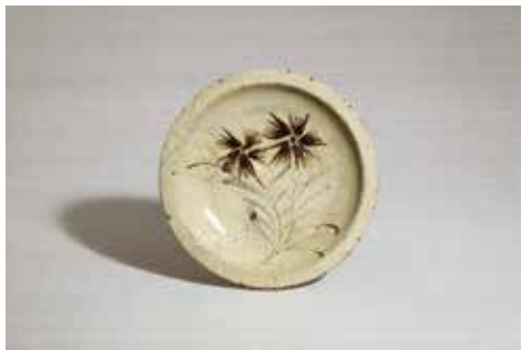
《呉須鉄絵撫子文石皿》 瀬戸(愛知)、江戸時代 19世紀、日本民藝館蔵