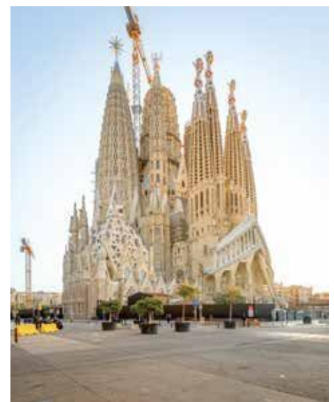
サグラダ・ファミリア聖堂、2023年1月撮影

○展示自体は良かったが、人がすぎてなかなかじっくり見られなかった。人数制限して欲しかった。