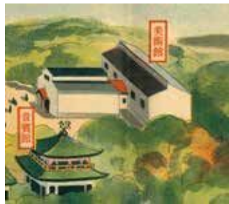
図2 「御大典奉祝名古屋博覧会鳥瞰図(部分)」、昭和3年(1928)、個人蔵

鶴舞公園美術館は文献・資料によっては「名古屋市美術館」と呼称されることもあります。昭和17年(1942)に解体されており(後述)、昭和63年(1988)に開館した名古屋市美術館とは歴史的な断絶があります。また、現在の名古屋市美術館とは異なり、特定のコレクションを持たず、公募展や巡回展を主に行うギャラリーとしての性格が強い美術館でした。今回の特集では、鶴舞公園美術館について、当時の中京美術界の状況を踏まえつつ紹介したいと思います。