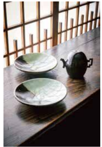
《緑黒釉掛分皿》因幡牛ノ戸(鳥取)、1931年頃 《銀石製業煎》朝鮮半島、朝鮮時代 19世紀 いずれも日本民藝館蔵