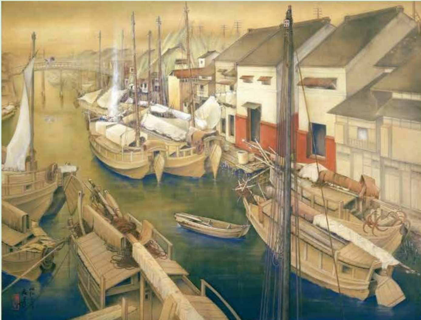
喜多村 麦子《暮れ行く堀川》、絹本着彩、昭和3年(1928)、名古屋市美術館蔵