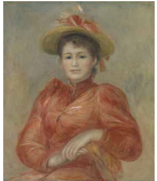
ビエール＝オーギュスト・ルノワール《赤い服の女》1892年頃／油彩、カンヴァス

今回の展覧会ではこのコレクションから厳選された約80点の絵画によって、西洋絵画400年の歴史を振り返ります。さら星のごとき巨匠たちの傑作の数々に目を奪われるだけでなく、理念や思想を伝える手段としての絵画から、色彩と形態の喜びをうたい上げる絵画へと、時代とともに変貌するその本質を学ぶことができます。「まるで美術の教科書を見ているようだ」。会場をめぐるあなたは、きっとそうつぶやくことでしょう。