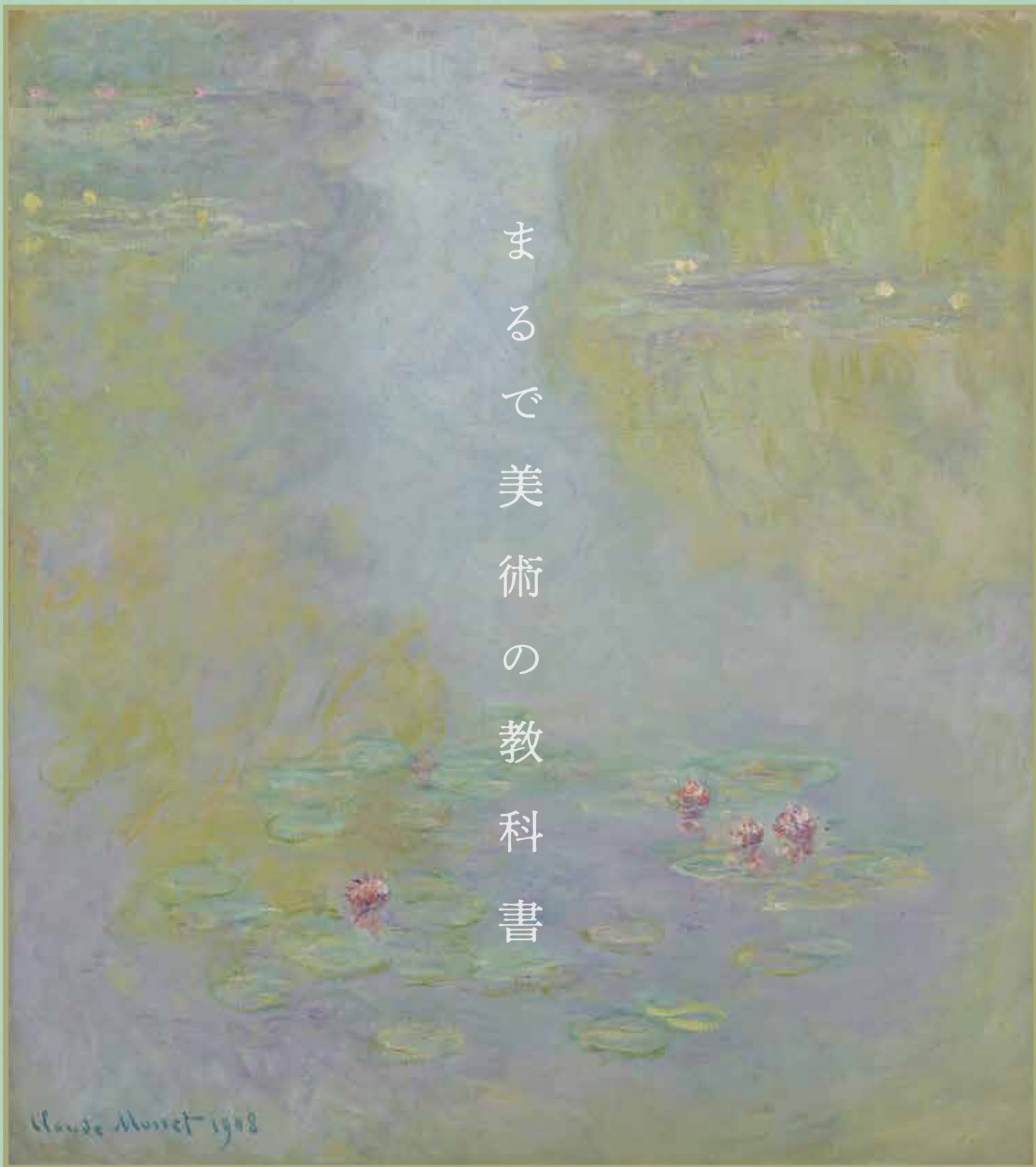
クロード・モネ《睡蓮》1908年／油彩、カンヴァス 東京富士美術館蔵