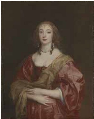
アントニー・ヴァン・ダイク《ベッドフォード伯爵夫人 アン・カーの肖像》1639年/油彩、カンヴァス