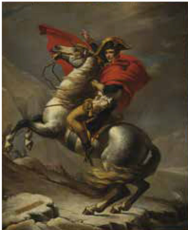
ジャック＝ルイ・ダヴィッドの工房《サン＝ベルナル峠を越えるボナバルト》1805年/油彩、カンヴァス