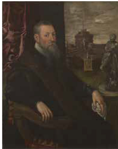
ティントレット(ヤコポ・ロブスティ)《蒐集家の肖像》1560-65年/油彩、カンヴァス