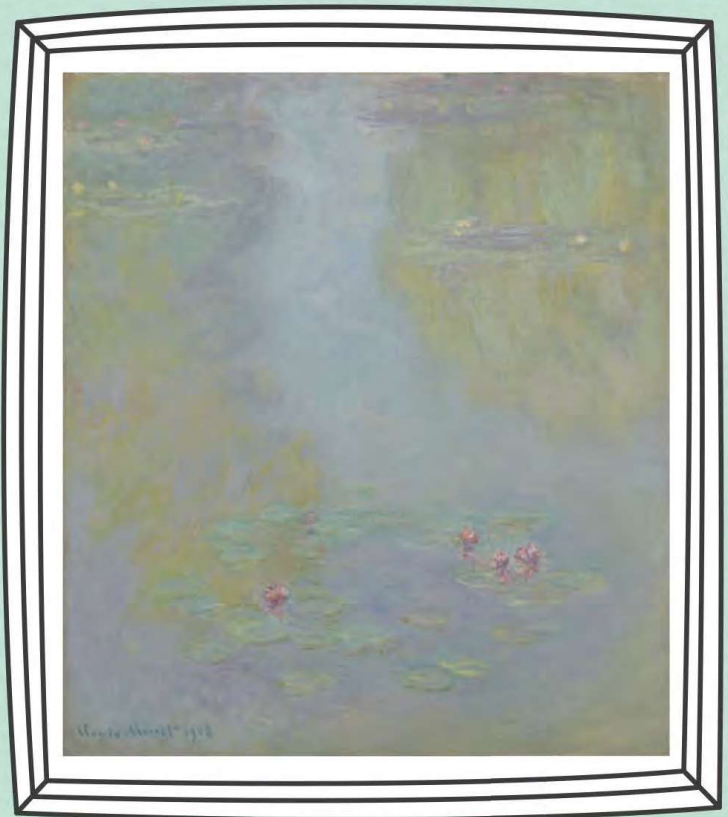
クロード・モネ《睡蓮》1908年 油彩・カンヴァス

ひだり え いま ねんまえ みぎ え えんまえ えが 左の絵は今からだいたい450年前、右の絵は100年前に描かれました。