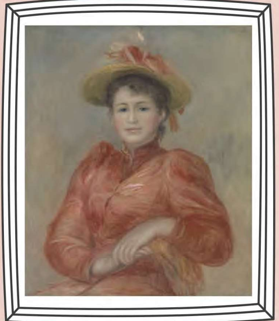
ピエール＝オーギュスト・ルノワール《赤い服の女》 1892年頃 油彩・カンヴァス