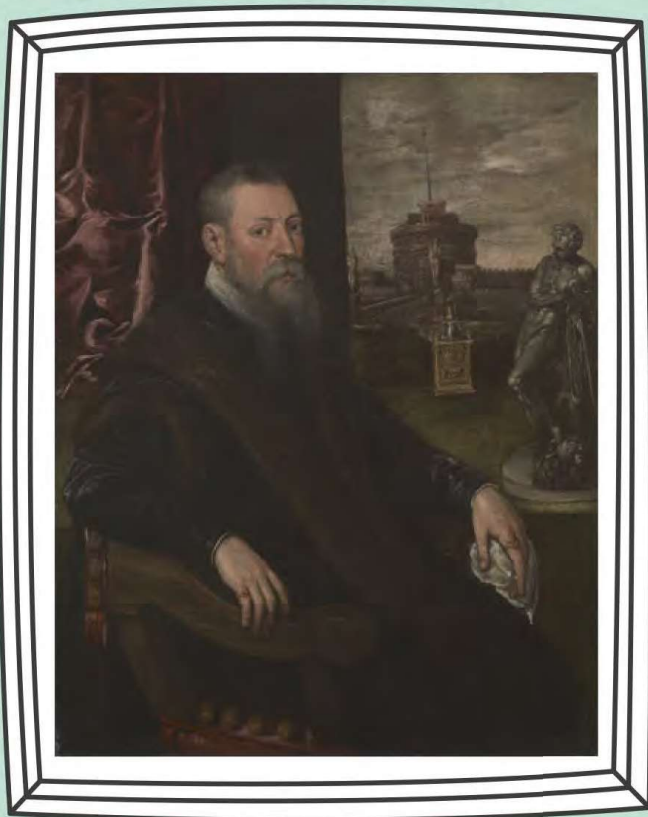
ティントレット(ヤコポ・ロブスティ)《蒐集家の肖像》 1560-65年 油彩・カンヴァス