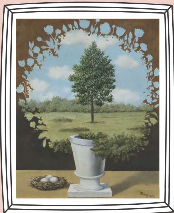
ルネ・マグリット《再開》1965年 油彩・カンヴァス