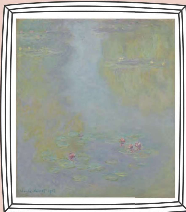
クロード・モネ《睡蓮》1908年 油彩・カンヴァス