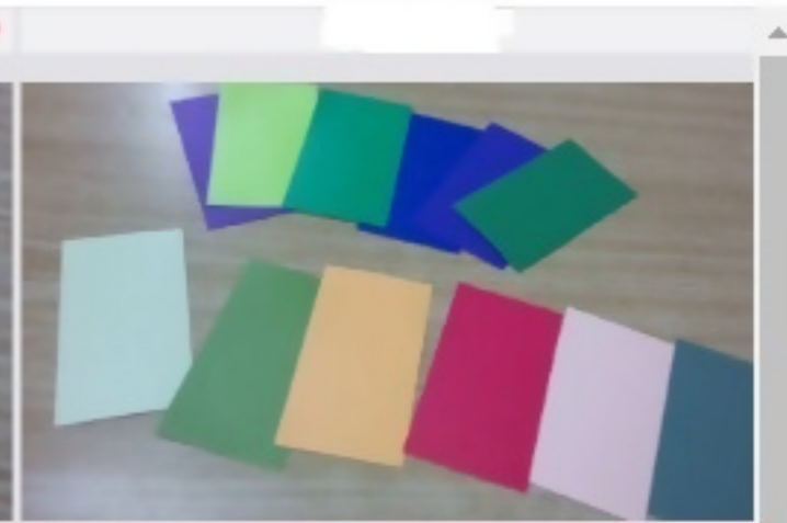
1/2 6月21日 11:23