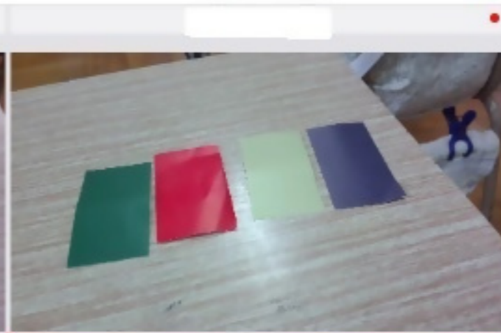
2/2 6月21日 11:23