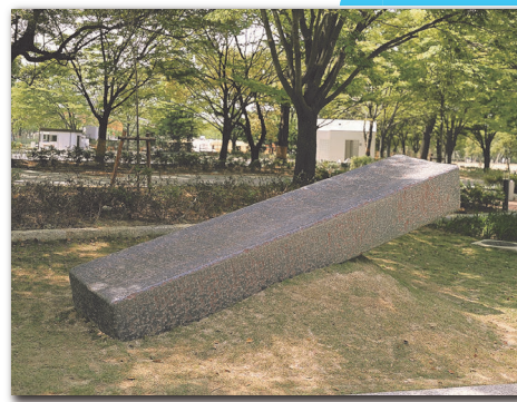
山口 牧生《傾かたち-四角柱》1986-88年