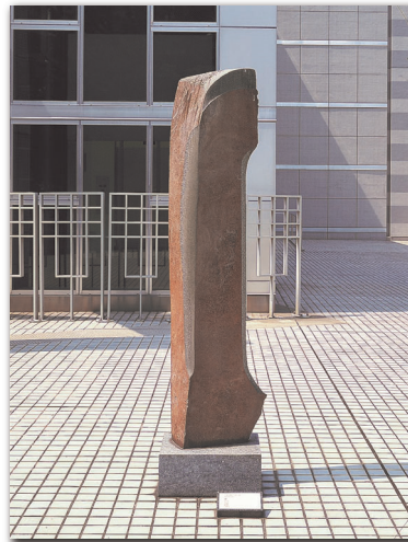
イサム・ノグチ《魂》1982年