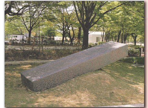
山口 牧生《傾くかたち-四角柱》1986-88年