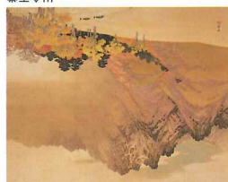
現代の美術 川合玉恵 1940年頃