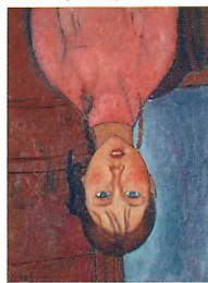
エーブル・ポ・リュ(1918年頃)

<コレクション> エーブル・ポ・リュ 1910年頃から1930年頃にかけて芸術の都パリに集まってきた外国人作家たちと、その周辺のフランス人作家の作品を収集しています。