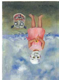
メキシコ・ルネサンス(死の仮面を被った少女) 1938年